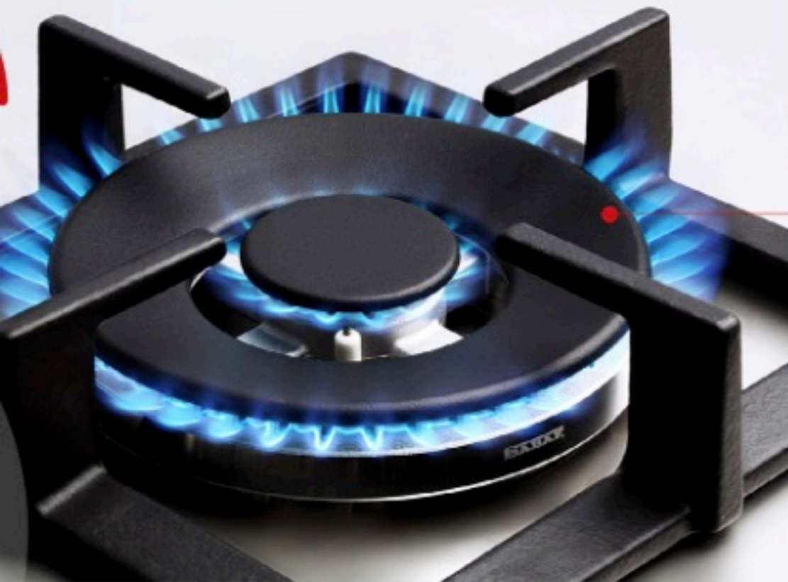
DCC Double Crown burner

be able to use alternative materials coming from secondary sources (scraps) instead of from primary ones. Granting, obviously, the same performance of our components and improving the environmental impact».